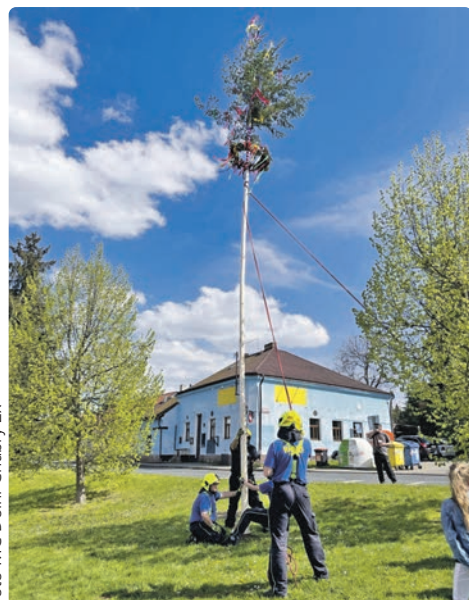
Májka, kterou stavěli v květnu, bude slavnostně „zbourána“ 1. června.