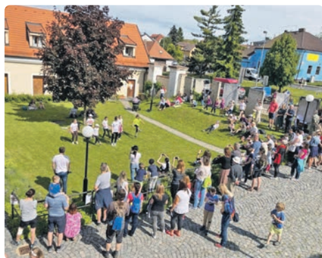
Každý rok se Den dětí těší hojně účasti.

T rhy tu budou 25. května, střídají se s těmi čimickými, jenž jsou o týden dříve. Na Hrušovanském náměstí od 8 do 12 hodin nakoupíte řadu regionálních produktů, které vás určitě zaujmou. Sýry,