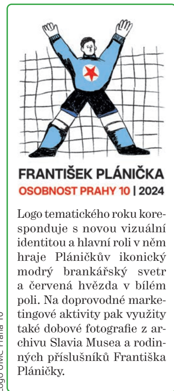
Logo ÚMČ Praha 10