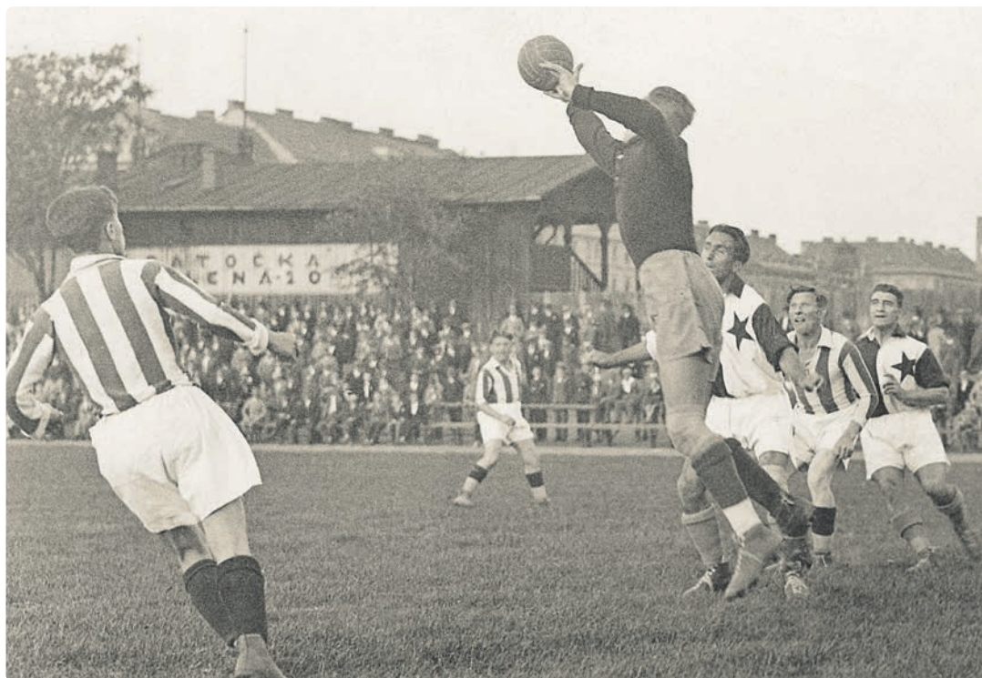
Brána pod jeho ochranou byla téměř vždy nedobytná.