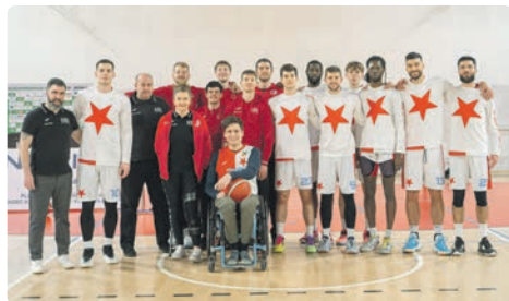
Basketbalisté Slavie při charitativní akci Bez faulu