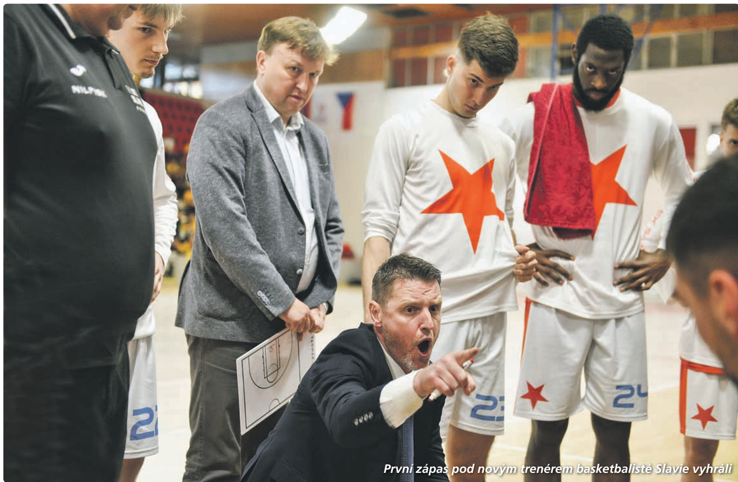
První zápas pod novým trenérem basketbalisté Slavie vyhráli

Po nevydařené základní části se již basketbalistům pražské Slavie nepodařilo výsledkově dotáhnout na vyšší příčky, čeká je tak dvojzápas o udržení v nejvyšší soutěži. Baráž sešivaní odehrají v první polovině května, tím pádem jim ještě zbývá dostatek času na kvalitní přípravu pod vedením nového trenéra.