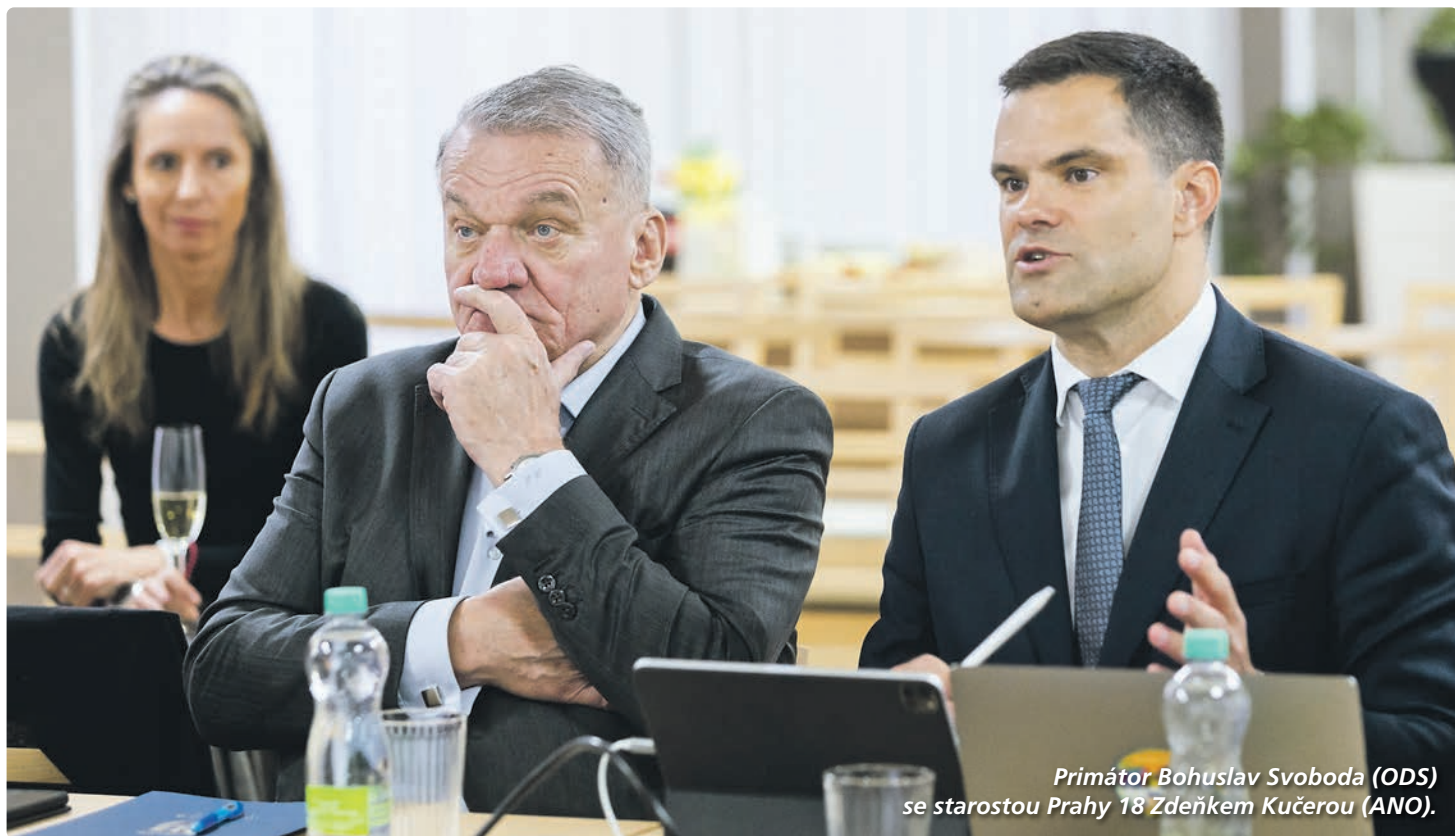
Primátor Bohuslav Svoboda (ODS) se starostou Prahy 18 Zdeňkem Kučerou (ANO).

Nejvyšší představitel hlavního města Bohuslav Svoboda (ODS) pokračuje v návštěvách jednotlivých městských částí, jak avizoval před rokem při svém opětovném nástupu do funkce. Tentokrát zavítal do Letňan a Čakovic, kde se probíralo řešení problémů s dopravou, kapacitou škol či zajištěním bezpečnosti obyvatel. A to i s ohledem na rozvojové projekty těchto částí.