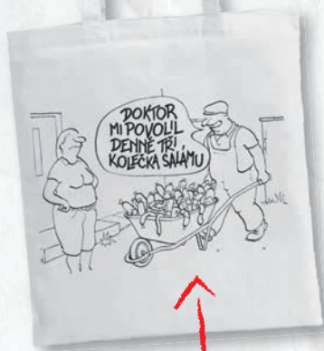
TAŠKA S POTISKEM SORRY