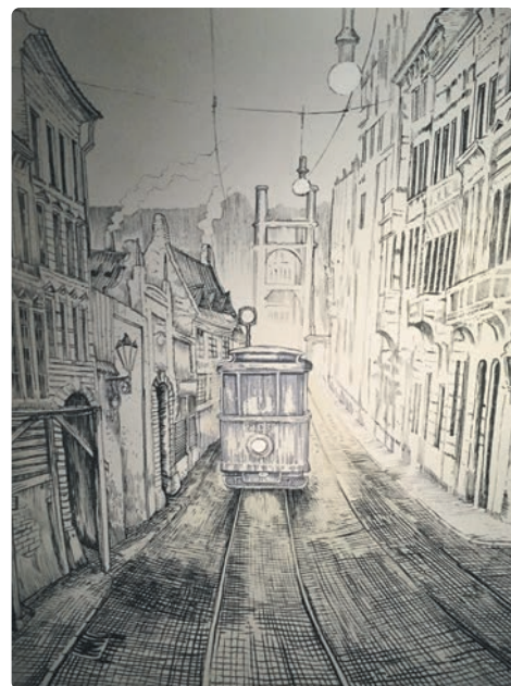
Tajemné uličky jeho Stínadel

zerní kotlině. Až to počasí dovolí, vezměte Foglarovu knihu, posaďte se na lavičku, přenechte se v čase do dob dávno minulých a prožijte dobrodružné příběhy plné fantazie. Věříme, že to by si sám Foglar přál. ■ red