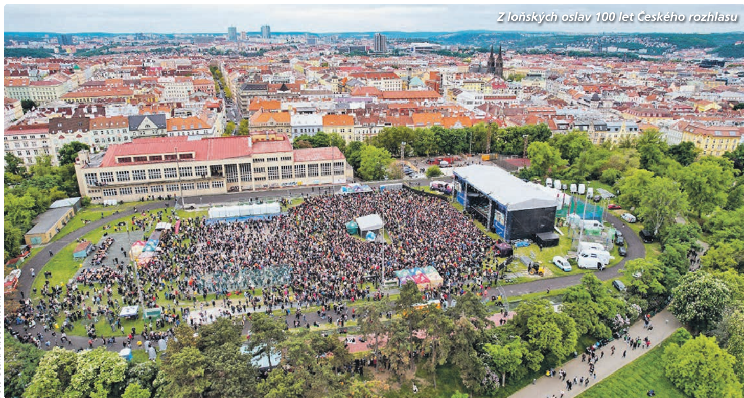
Z loňských oslav 100 let Českého rozhlasu

Na malebné návrší Riegrových chodí Pražané za odpočinkem a obdivovat výhled na Pražský Hrad. Mnozí z nich sem ale míří za pohybem do jedné z největších sokoloven v Česku. V památkově chráněné budově Sokola Praha Královské Vinohrady je dnes a denně živo od všestrannosti přes gymnastiku, florbal až po plavání a jógu. V dohledné době se nabídka může rozšířit, na spadnutí je rekonstrukce atletické dráhy a existuje i studie na novou halu.