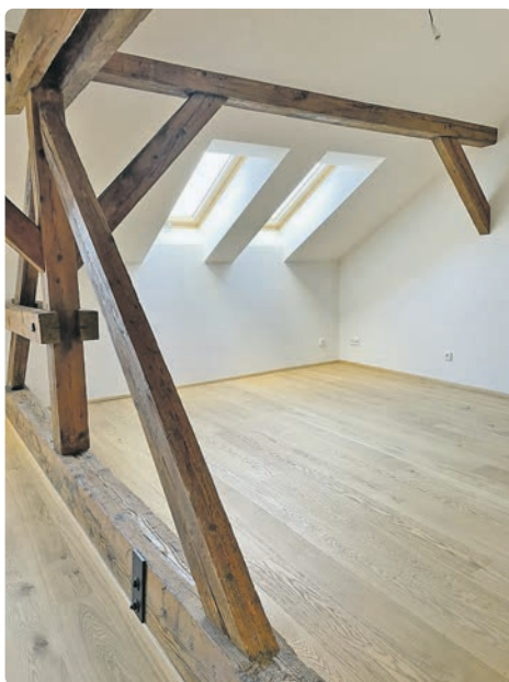
Podkrovní byt v ulici Na Moráni

„Jsem velice ráda, že velkých změn dostala podpora mladých začínajících rodin. Pomůžeme tak mladým párům překlenout ekonomicky nejobtížnější léta spojená s rodičovstvím či začátkem profesní dráhy. Zatímco seniorům poskytujeme pomoc trvalou, mladým rodinám pomáháme na začátku. Do skupiny mladé rodiny přitom zahrnujeme také bezdětné páry, které založení rodiny te-