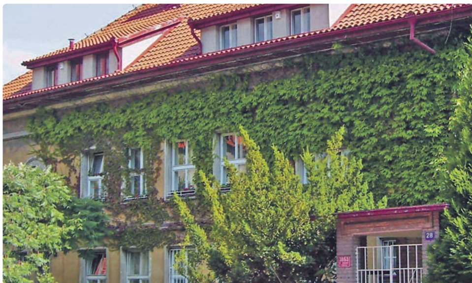
Radnice neplánuje vytvořit z ikonické vily přetěžovanou turistickou atrakci.

od zakoupení poloviny domu. Zatím se v ní uskutečnil stavebně-historický a restaurátorský průzkum a také inventarizace a uskladnění původního vybavení spolu s Čapkovým rozsáhlým archívem písemností.