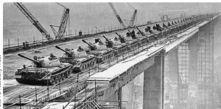
Nuselský most

TSK v letech 2012 až 2017 most postupně opravila. Silničáři