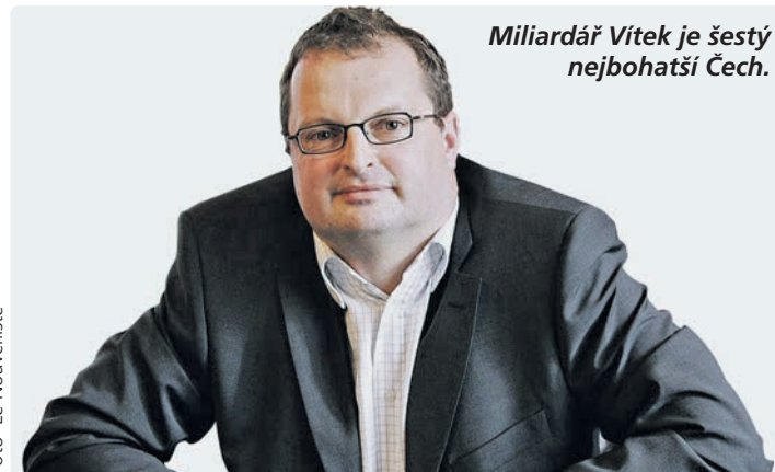
Miliardář Vítek je šestý nejbohatší Čech.

V Česku vlastní CPIPG hotely Clarion v Českých Budějovicích, Praze a Ostravě či pražské hotely Mamaison Hotel Riverside a Buddha-Bar Hotel. Na dotaz, které hotely jsou součástí obchodu a jak vysoká byla cena, sku-