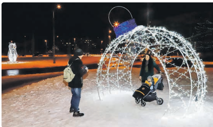
Světelná koule na Šestáku

Písecká brána letos opět připravila kromě pořadů pro děti