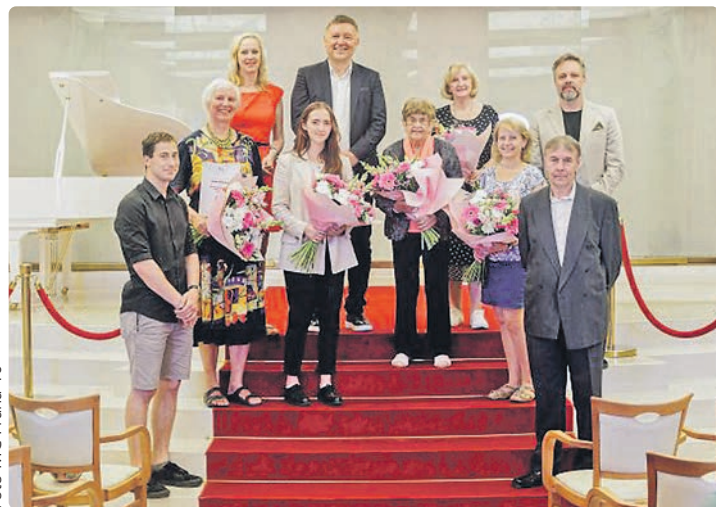
Dobrovolníci roku 2022

Posláním obecně prospěšné společnosti Proxima Sociale je zvyšovat kvalitu života občanů a pomáhat jim překonat nepříznivé životní situace. Centrum pro dobrovolnictví Hestia se věnuje podpoře dobrovolnictví na všech jeho úrovních. Poskytuje kompletní servis v oblasti dobrovolnictví, organizujeme dobrovolnické programy, školení, koor-