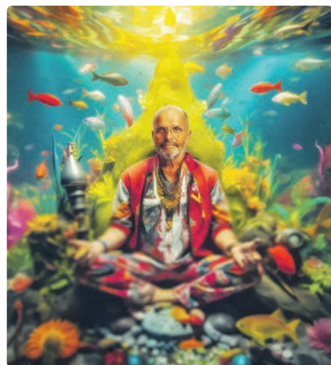
Duben – Zdeněk Pohlreich – Nejdůležitější věci se odehrávají pod hladinou