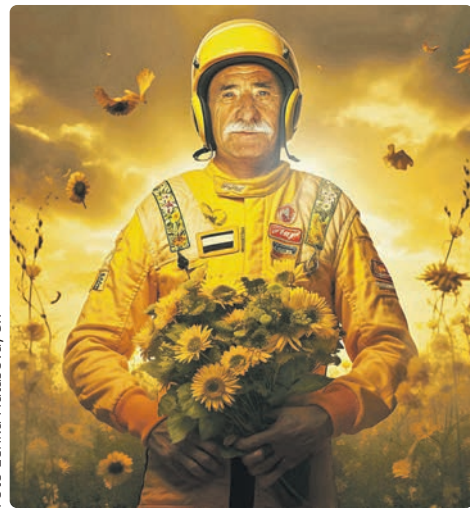
Červen – Pavel Zedníček – Závodník Romantik

Kalendář Proměny se za roky své existence stal sběratelským artefaktem, mezi sběrateli umění a dražiteli kolují i velkoformátové zvětšeniny originálů samotných portrétů, které je i letos možné opět ve prospěch nadace vydražit. Ta si již léta klade za cíl humanizaci dětských zdravotnických zařízení. „Důvod, proč o tohle všechno usiluji je prostý – v nemocnici by se nemělo léčit pouze tělo, ale i obolavělá duše. Pohoda a harmonie jsou přece základním předpokladem fyzického zdraví,“ řekla herečka a zakladatelka projektu Chantal Poullain, jejíž portrét ve