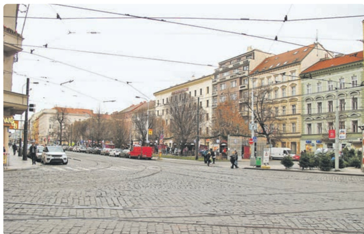
Tylovo náměstí v prosinci 2019