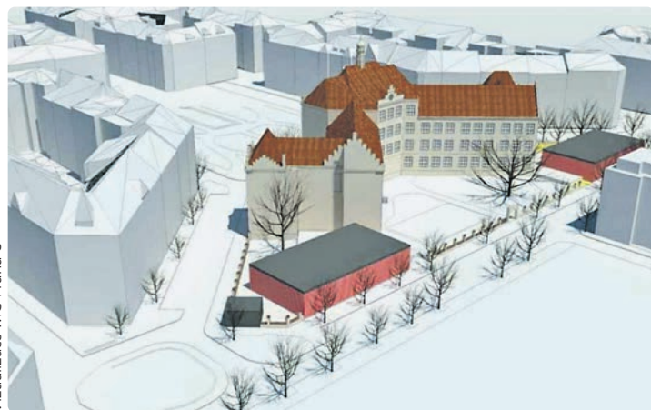
Vizualizace MC Praha 8

„V Praze 8 máme spočítané, že do základního školství musí putovat investice za více než 2 miliardy korun a je jasné, že sa-