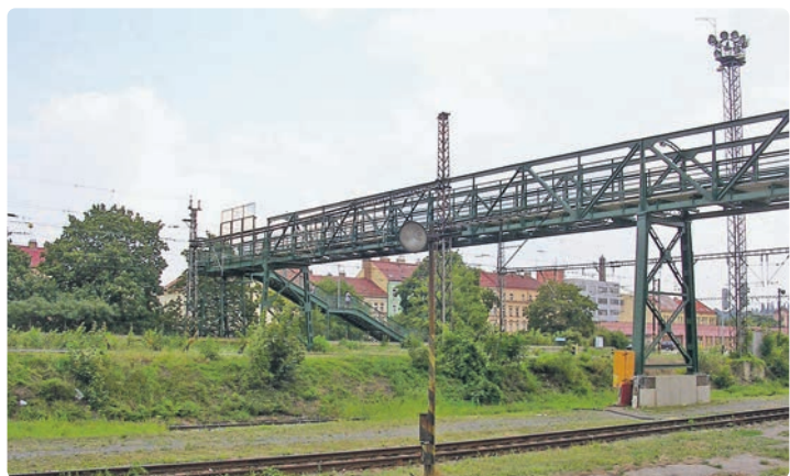
Lávka přes Smíchovské nádraží v roce 2006