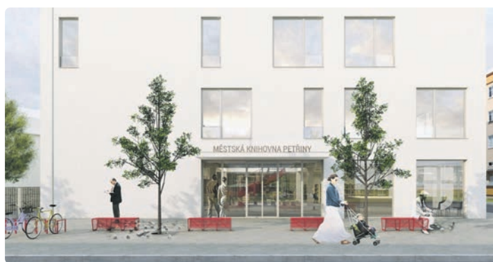
Vizualizace MONOM architekti, 2x

projekt dotáhl do cíle. Pro Prahu 6 má knihovna nesmírný význam, jako přirozené kulturně-komunitní centrum Petřin. Dosud tam totiž velmi chybělo,“