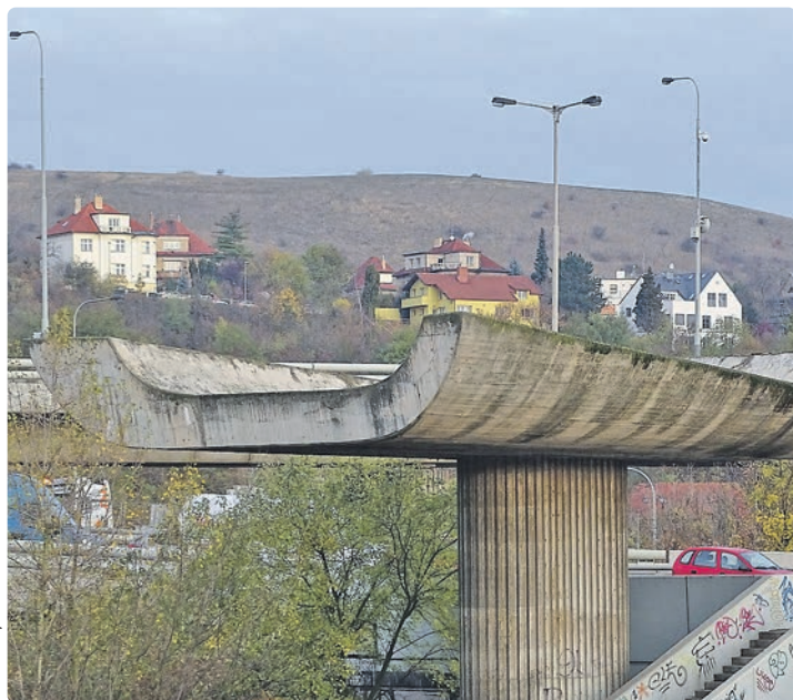
Jižní plastika Hroší lázeň, barrandovské předmostí

Barrandovský most z roku 1983 je součástí městského okruhu. Denně ho přejede na