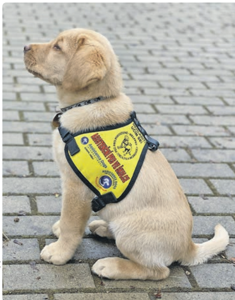
Helpes pomáhá osobám s nejrůznějšími druhy handicapů na jejich cestě k integraci, soběstačnosti a samostatnosti

Helpes pomáhá osobám s nejrůznějšími druhy handicapů na jejich cestě k integraci,