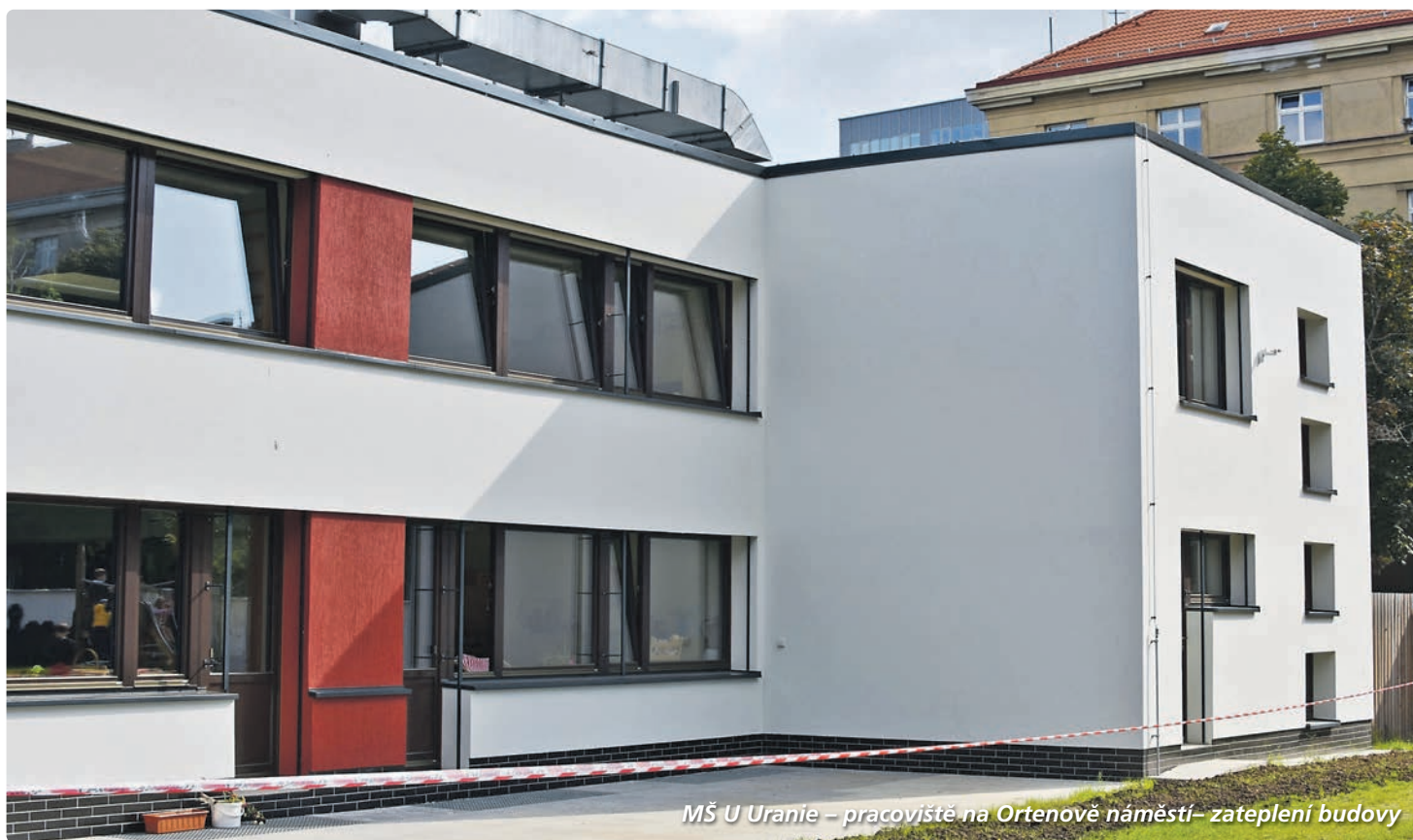
MŠ U Uranie – pracoviště na Ortenově náměstí – zateplení budovy

Školy, školky i bytové domy ve správě sedmé městské části procházejí v posledních letech velkými opravami a rekonstrukcemi. Městská část se při nich zaměřila i na snížení energetických nákladů spojených s jejich provozem. Ty se teď začínají vyplácet, městské kase ročně ušetří miliony korun, naíc se investice platí z uspořené peněz.