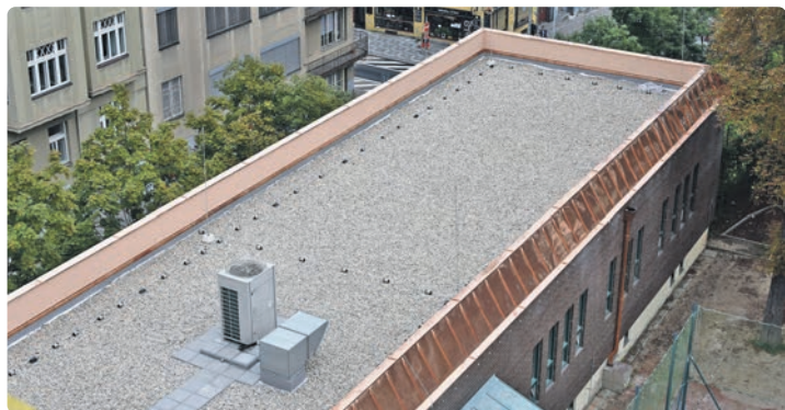
ZŠ Fr. Plamínkové – zrekonstruovaná střecha jídelny