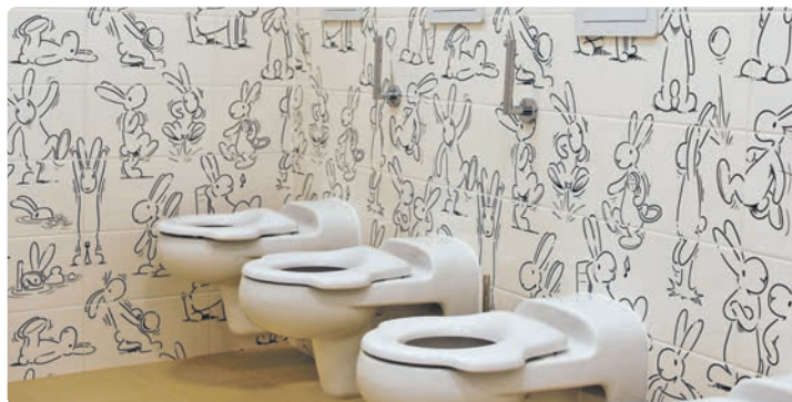
I toaleta může být úsporná – MSŠ Varhulíkové

Modernizací energetického hospodářství už má za sebou jedenáctka budov. Konkrétně osm škol a tři domy s pečovatelskou službou. Ve ZŠ Strossmayerovo náměstí a Korunovační byla v létě 2022 dokončena závěrečná etapa kompletní rekonstrukce elektrorozvodů. Následně prošly renovací elektrorozvody ve škole Tusarova. V ZŠ Fr. Plamínkové rekonstruovali střechu. V ZŠ T. G. Masaryka na Ortenově náměstí dokončily rozsáhlou modernizaci gastroprovozu a stavební úpravy dvou tříd a kabinetu. Nově rekonstruované třídy má také v ZŠ Letohradská, ve