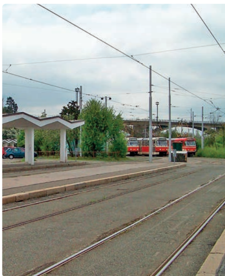
Tramvajová smyčka Nádraží Braník

V první etapě, která potrvá do úterý 9. května nejezdí tramvaje mezi Podolskou vodárnou a Sídlištěm Modřany. Pro cestující zavedena náhradní autobusová doprava X2, X17 a X92. Ve druhé a poslední etapě bude výluka tramvajů zkrácena na úsek Nádraží Braník – Sídliště Modřany. Pražský dopravní podnik (DPP) začal od soboty 1. dubna na několika místech opravovat tramvajovou trať v Modřanské a v ulici Generála Šišky. Na odbočení k zastávce Přístaviště bude vyměňovat opotřebené obloky. V úseku od odbočky do smyčky Nádraží Braník po zastávku Černý kůň bude obnovovat celý kolejový svršek, tedy měnit jak pražce, tak i stávající žlábkové kolejnice za bezžlábkové. Stejně práce proběhnou v úseku Čechova čtvrť – Poliklinika Modřany,