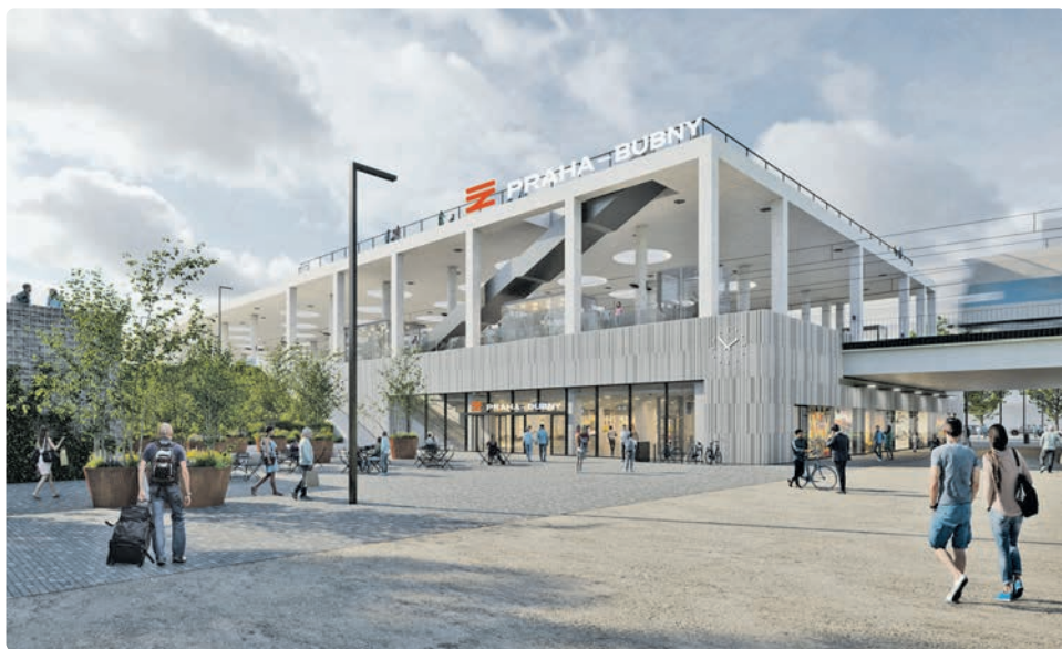
Vizualizace Správa železnic

Od poloviny března zahájila Správa železnic výluky mezi stanicemi Praha Masarykovo nádraží a Praha-Dejvice. Provoz je zastaven z důvodu pokračující modernizace nádraží Praha-Bubny a navazujícího úseku k nově budované zastávce Praha-Výstaviště. Omezení by podle současných plánů mělo skončit v příštím roce.