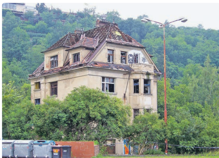
Vila Milada tři dny po vyhnání squatterů