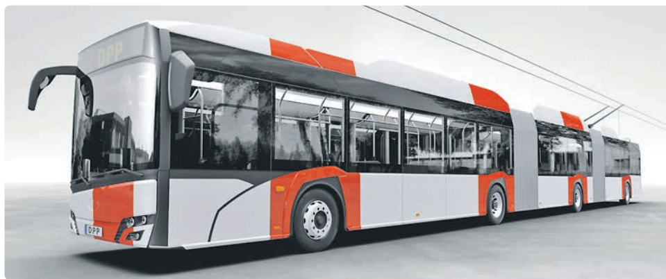
Vizualizace tříčlánkového trolejbusu Škoda-Solaris 24m

R ealizovat ji bude společnost Elektrizace železnic Praha, která zvítězila ve veřejné zakázce. Předpokládané náklady činí 354,5 milionu korun. Zahájení zkušebního provozu na druhé trolejbusové trati v novodobé historii Prahy se předpokládá začátkem roku 2024. Výstavba trolejbusové tratě na Letiště Václava Havla Praha je součástí projektu elektrifikace autobusové linky číslo 119, kterou schválil radní hlavního města v září roku 2019. V areálu garáže Řepy pražského Dopravního podniku (DPP) v rámci tohoto projektu postaví novou zdě-