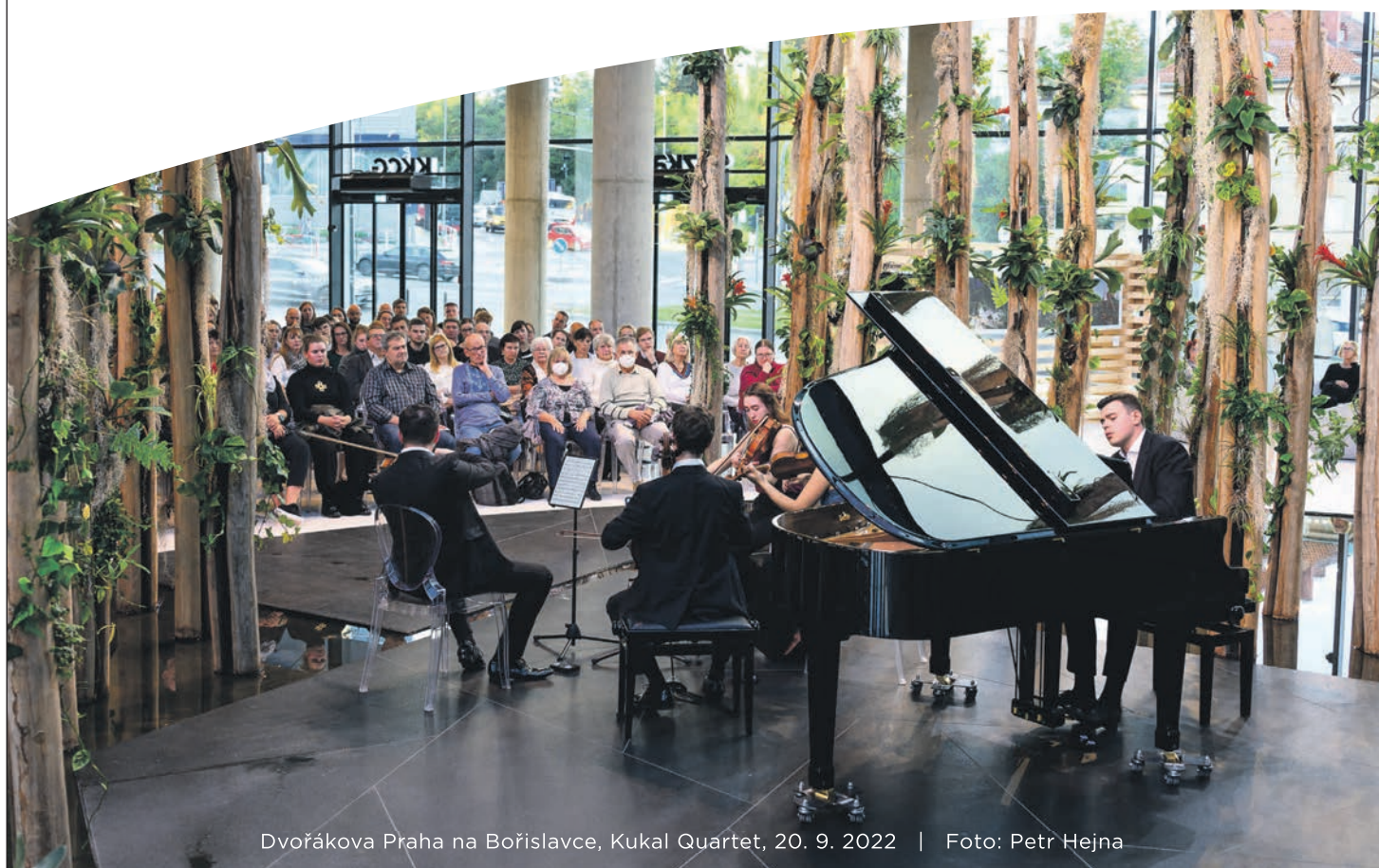
Dvořákova Praha na Bořislavce, Kukul Quartet, 20. 9. 2022