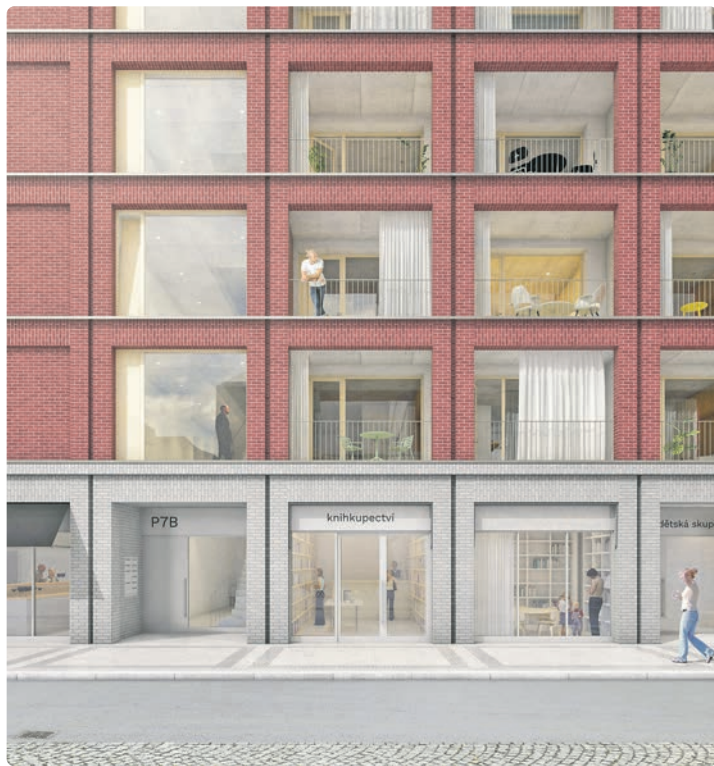
Fasáda městského bytového domu je jednoduchá.

To, co odliší nový bytový dům na Sedmičce od jiných novostaveb a dá jí punc výjimečnosti, bude sousedské setkávání. „Vy-