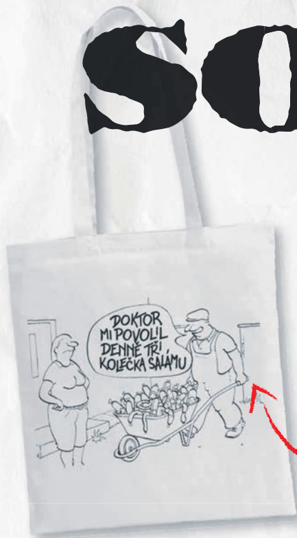
TAŠKA S POTISKEM SORRY